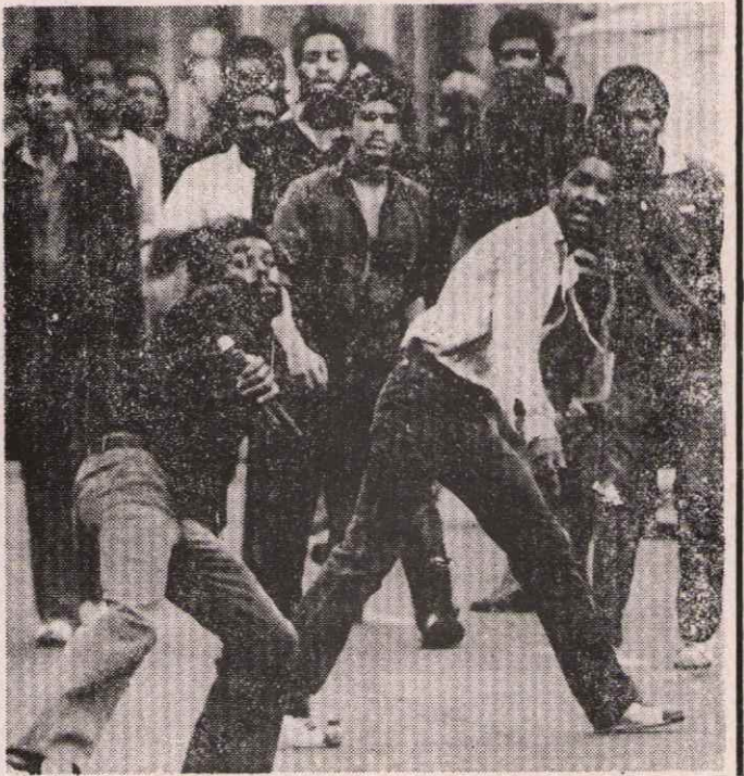
SIY AHLAR İNGİLİZ POLİSİNE KARŞI DİRENİYOR

İşte bu şartlarda, özellikle de son yıllarda, siyahlar, üzerlerindeki baskılara karşı aktif bir şekilde direnişler ve polisle çeşitli kereleler çatışmaya girmişlerdir. İlk büyük ayaklanma 1958'de Londra'nın Notting Hill bölgesinde ve Nottingham şehrinde olmuştur. Daha sonra bir dizi ayaklanmalar içinde son dönemde 1979'da Londra'nın Lewisham ve Southall bölgelerinde meydana gelen ayaklanmalarda polislerle zorlu çatışmalar olmuştur. En son da bir yıl kadar önce Bristol şehrinin St. Paul's bölgesinde polise karşı şanlı bir direniş olmuştur. Hakim sınıfların bunları birer siyah-beyaz çatışması haline getirme çabalarına rağmen, bu mücadelelerin hemen hepsi polise karşı gelişen mücadeleler olmuş ve çoğu kez beyaz işçiler de siyah-