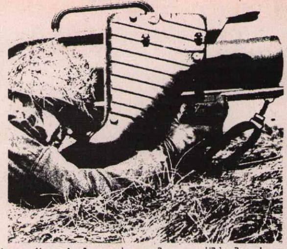
"Dünya üzerinde çatışmaların ülkeleri sarstığı, insanların birbirine ateş ettiği her yerde "made in Germany" damgalı silahlar rağbet görmektedir." (Stern)

Elbette ki amaçları bu ülkelere başka ülkelere serbestçe (yani suratlarını gizleyerek ve Batı Alman demokrasisini(!) zedeledikten) silah satabilmektir.