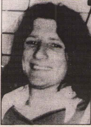
• BOBBY SANDS